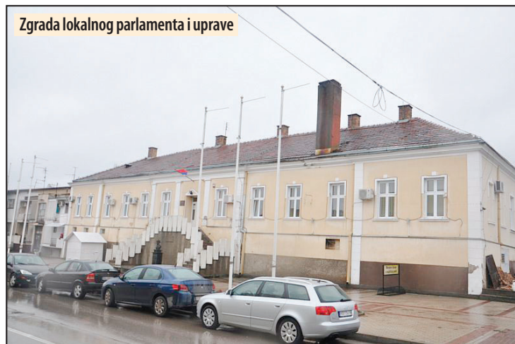
Zgrada lokalnog parlamenta i uprave

Prošla godina bila je veoma uspešna, naročito u oblasti izgradnje putne infrastrukture. Završeno je asfaltiranje Omladinske ulice sa platoom u centru Aleksandrovca, Jug Bogdanove i Partizanske ulice u Vlaškom Dolu, deo Sme-