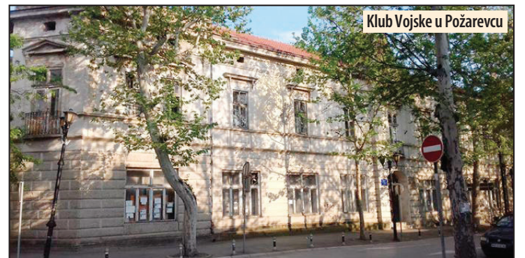
Klub Vojske u Požarevcu

risnika, kojima će se iz gradskog budžeta dodeliti ukupno 91.957.000 dinara. Najviše novca dobiće Odbojkaški klub „Mladi radnik“ - 17 miliona i Fudbalski klub „Mladi radnik 1926“ - 13 miliona dinara. M. V.