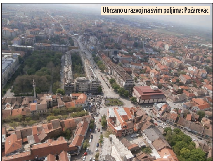
Ubrzano u razvoj na svim poljima: Požarevac

Staro groblje: Planirano je manje proširenje Starog groblja prema istoku, za oko 0,86 hektara. Planira se otvaranje još jednog ulaza u Staro groblje, prema Ulici Rade Slobode, odakle bi bila ostvarena veza sa novoplaniranim parkingom u tom bloku. Z. V.