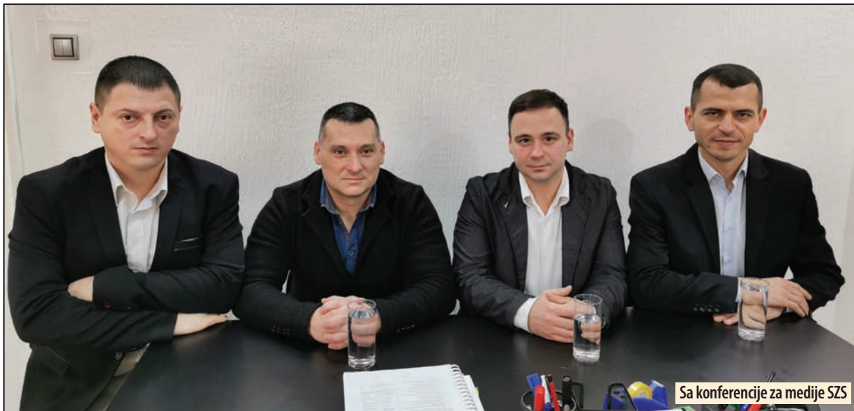
Sa konferencije za medije SZS

sebnim potrebama, hoće li plate koje građani dobijaju biti dostojne čoveka za normalno podmirivanje njegovih potreba, hoće li roditelji bolesne dece preklinjati po društvenim mrežama građane da šalju SMS poruke za lečenje njihove dece ili će država da radi svoj posao, hoće li više od 50.000 ljudi svake godine bežati iz naše zemlje, hoće li starice po selima braniti reke svojim telima, koliki će biti porezi, kolika će biti minimalna zarada, kolika će biti cena struje, kolika će biti cena goriva, hoće li Jutke zlostavljati