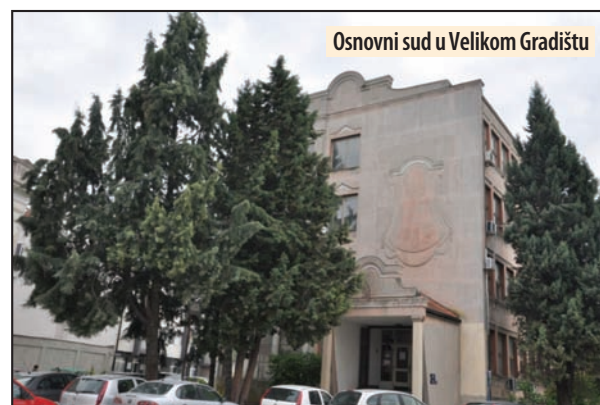
Osnovni sud u Velikom Gradištu