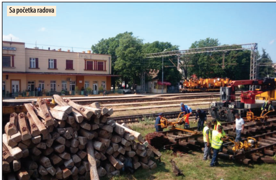
Sa početka radova

Požarevac - Kako saopštava izvor „Infrastruktura železnice Srbije“, u okviru modernizacije pruge Jajinci - Mala Krsna, kojom se odvija i saobraćaj od Požarevca do Beograda, u proteklih devet meseci završena je ukupno trećina posla a saobraćajnica bi trebalo da bude otvorena do avgusta tekuće godine. Stepen izvedenih radova na donjem stroju iznosi oko 40 odsto, a stepen nabavke materijala za ovaj projekat oko 70 odsto.