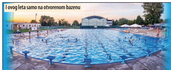
I ovog leta samo na otvorenom bazenu

Previđeno je da se projektuju dva bazena dimenzija 25x21x2 metra i 7,5x15x0,8-1,2 metra, kao i hidromasažna kada dimenzija 7,5x3 metra. Objekat zatvorenog bazena trebalo bi da bude funkcionalno povezan sa halom i postojećim otvorenim bazenom. Od pratećih sadržaja predviđeno je da u objektu budu tri-