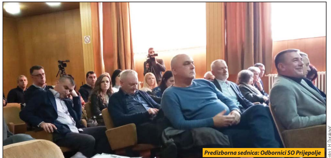
Predizborna sednica: Odbornici SO Prijepolje