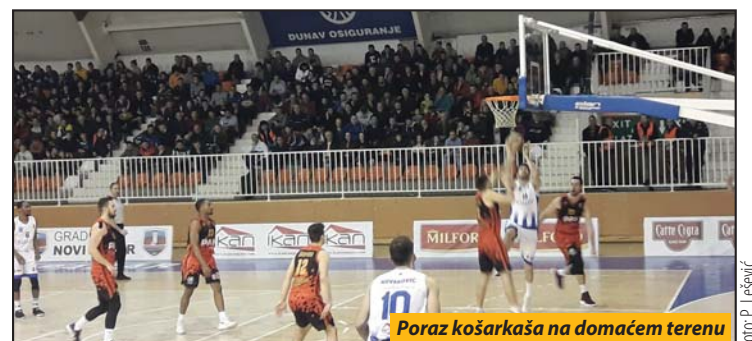
Poraz košarkaša na domaćem terenu

lično odigranoj poslednjoj četvrtini 74:78 (16:17, 26:26, 18:15, 14:20). Najbolji u domaćem sastavu bio je Todirović (20 poena), kod gostiju Meknajt (27). Tri kola pre kraja lige Novi Pazar je deseti sa sedam pobeđa. P. L.