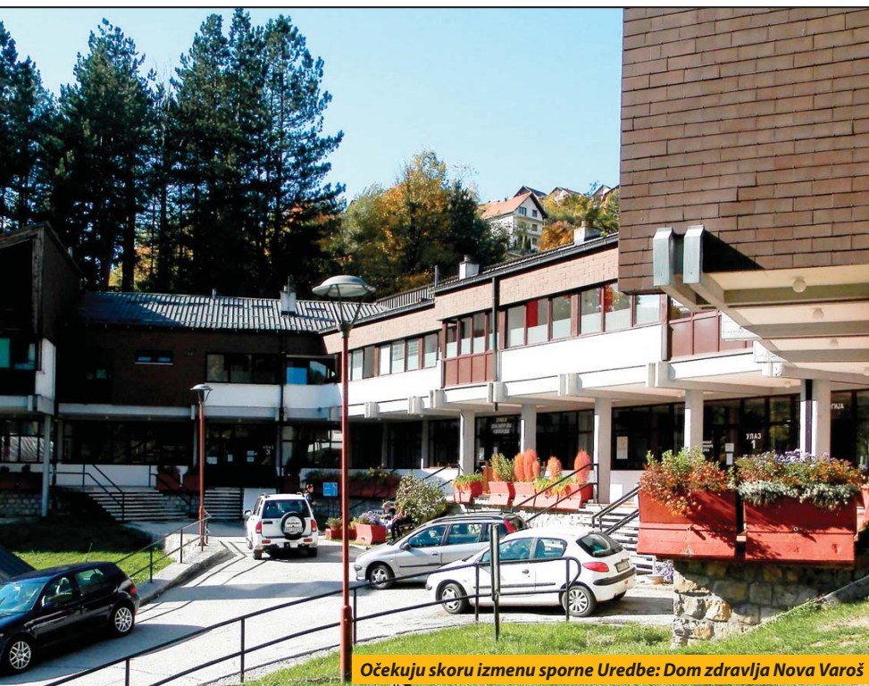
Očekuju skorou izmenu sporne Uredbe: Dom zdravlja Nova Varoš

ini Centar „Bona fide” registrovao 91 slučaj porodičnog nasilja u Pljevljima