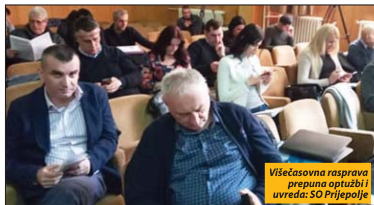
Višerasovna rasprava prepuna optužbi i uvreda: SO Prijepolje