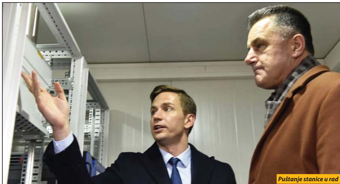
Puštanje stanice u rad

Merna stanica je prvog dana pokazala da vazduh ima kvalifikaciju „nezdrav“