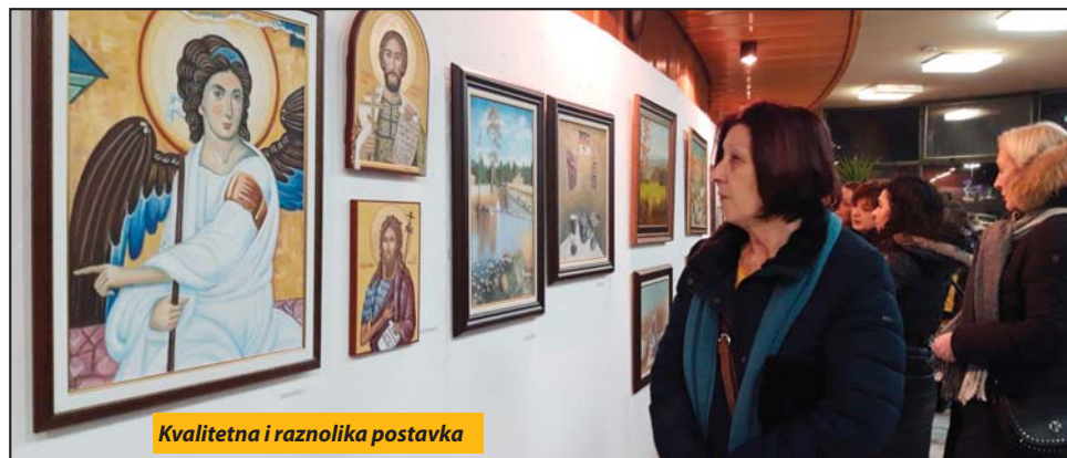
Kvalitetna i raznolika postavka

Nova Varoš - Ljubitelji slikarstva imaju priliku da u narednih mesec dana u galerijskom prostoru Doma kulture pogledaju izložbu radova novovaroških slikara, članova Likovnog kluba „Zlatarska paleta“. Na tradicionalnoj smotri ovog puta svoje tematski raznoliko stvaralaštvo predstavilo je 11 lokalnih autora.