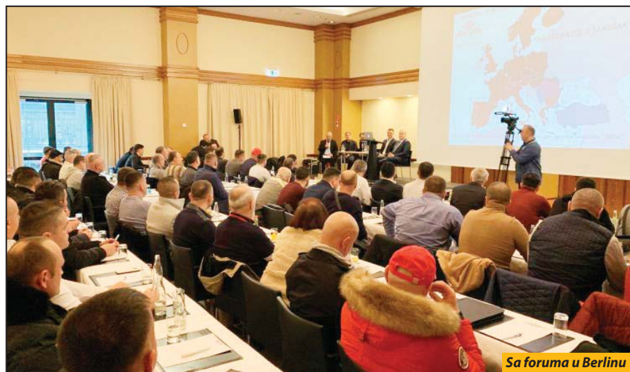
Sa foruma u Berlinu