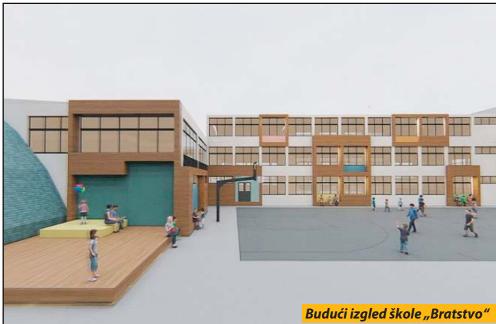
Budući izgled škole „Bratstvo“

- Mislimo na bezbednost učenika i nastavnika pa će ovi grubi radovi biti završeni do početka drugog polugodišta. Onda ćemo nastaviti sa unutrašnjim finim radovima kako što je uvođenje strujne instalacije, sređivanje kanalizacione mreže i ostalo, rekao je direktor škole „Bratstvo“. Kompletna rekonstrukcija škole obuhvatiće promenu fasade, elektroinstalacija, grejanja, stolarije, mokrih čvorova, stepeništa, krova, ali izgradnju šest novih učionica, četiri kancelarije i lifta za učenike sa posebnim potrebama. Takođe, škola će dobiti i bazen, dimenzija 25 sa 12 metara, a osim učenika, moći će da se koristi i za pojedina takmičenja. S. D.