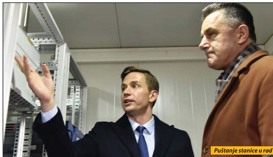
Puštanje stanice u rad

Merna stanica je sačinjena od najsavremenije opreme i nalazi se na rekreacionom centru. Razlog za odabir ove lokacije je