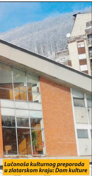
Lučonoša kulturnog preporoda u zlatarskom kraju: Dom kulture

je o melodrami sa elementima komedije koja oživljava period Drugog svetskog rata.