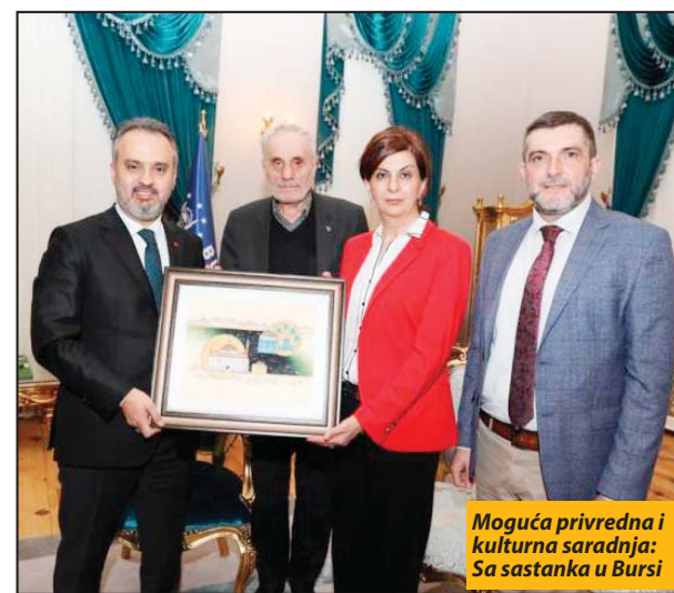
Moguća privredna i kulturna saradnja: Sa sastanka u Bursi