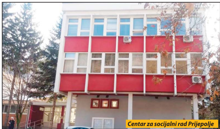
Centar za socijalni rad Prijepolje

Zlostavljanje dece je posredica nasilja u porodici koje spada u najteže oblike traumatskog iskustva sa trajnim posledicama na razvoj deteta, posebno kad je reč o njegovom emocionalnom sazrevanju. I. H. D.