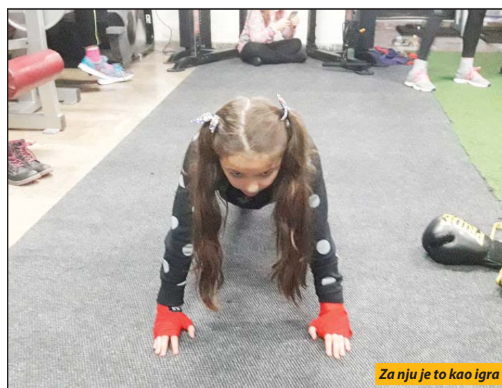
Za nju je to kao igra