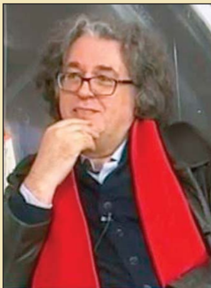
Piše: Mehmed Slezović

„Deklaracija” jeste napisana u Sarajevu 1970 godine, 1990. Postala je dostupna širim slojevima. U međuvremenu ova knjiga je bila povod za osudu na višegodišnju robiju njenog autora i grupe istomišljenika oko njega. Tokom