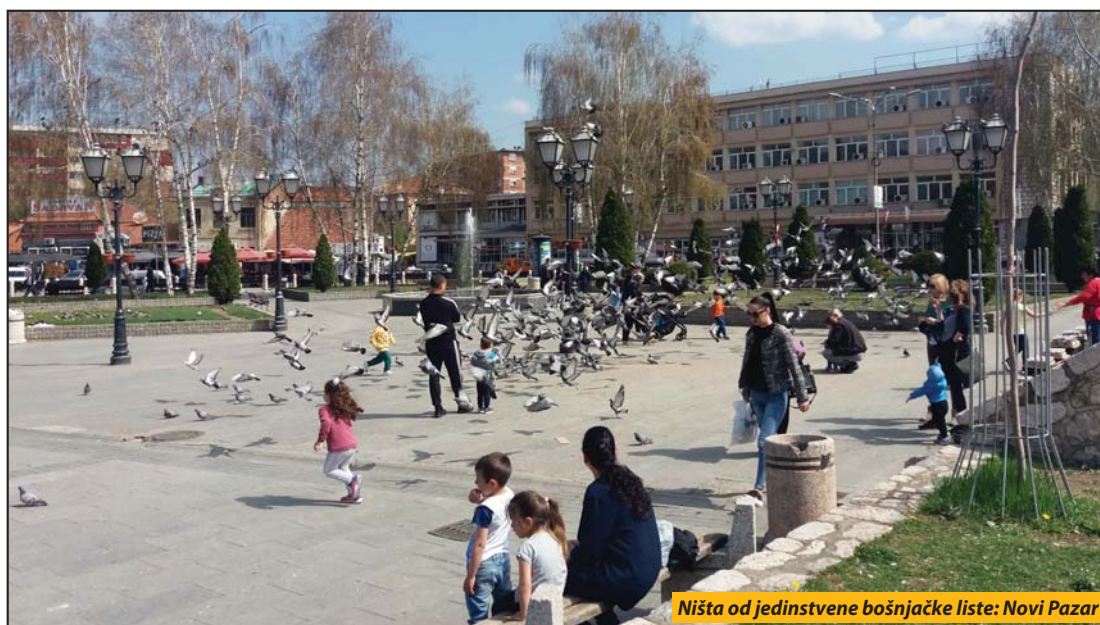
Ništa od jedinstvene bošnjačke liste: Novi Pazar

Novi Pazar - Gradska izborna komisija u Novom Pazaru održala je prvu sednicu na kojoj je usvojila odluku za sprovođenje izbora za odbornike Skupštine grada. Iz gradske uprave je saopšteno da su neophodnu dokumentaciju preuzele Sandžačka demokratska partija (SDP), SNS i Stranka pravde i pomirenja (SPP).