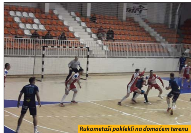
Rukometaši poklekli na domaćem terenu