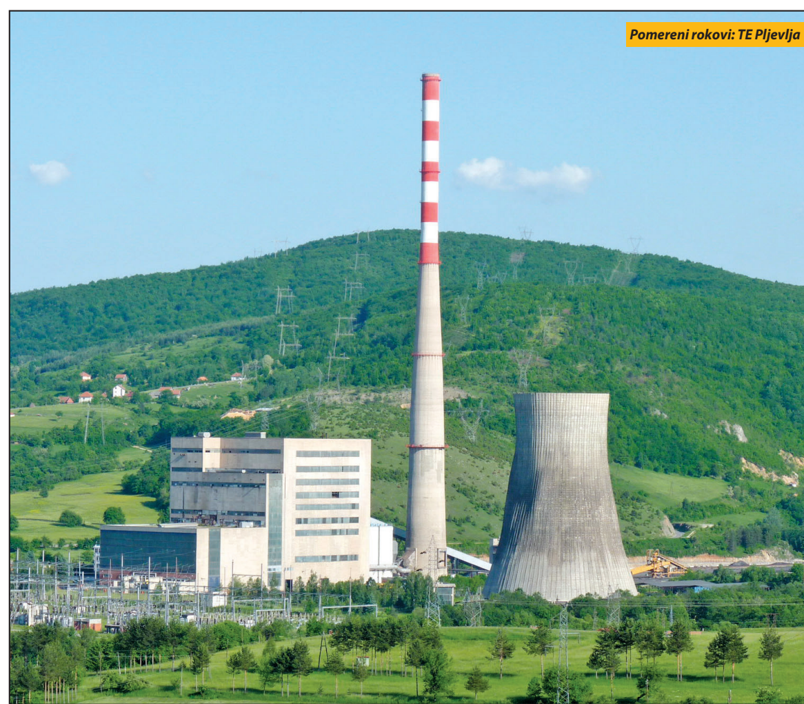
Pomereni rokovi: TE Pljevlja

Komisija za otvaranje i vrednovanje EPCG izabrala je 8. novembra prošle godine ponudu, vrijednu 54.427.700 evra konzorcijuma koji predvodi kineski DEC, a u kojem je i sin predsjednika Crne Gore Blažo Đukanović, preko firme BB Solar. Prema prvobitnim najavama, ugovor o ekološkoj rekonstrukciji TE trebalo je da bude potpisan do kraja 2019. godine, što se nije desilo i to pomjera željene rokove za početak ovog posla od kojeg zavisi i čistiji vazduh u Pljevljima, najzagađenijem crnogorskom gradu.