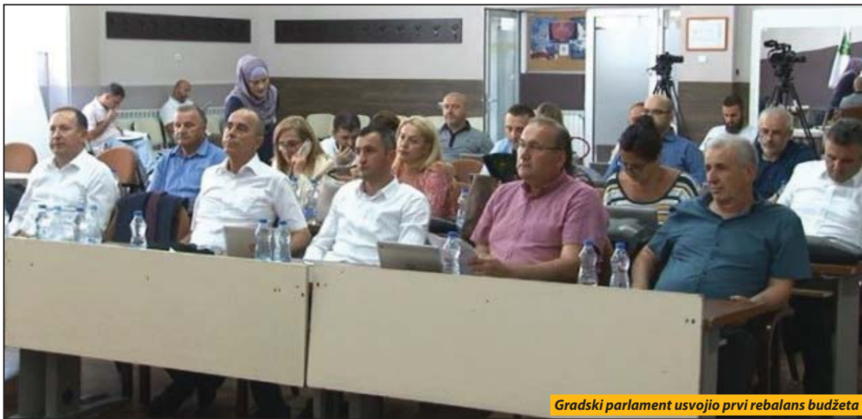
Gradski parlament usvojio prvi rebalans budžeta

Skupština grada Novog Pazara usvojila prvi rebalans budžeta