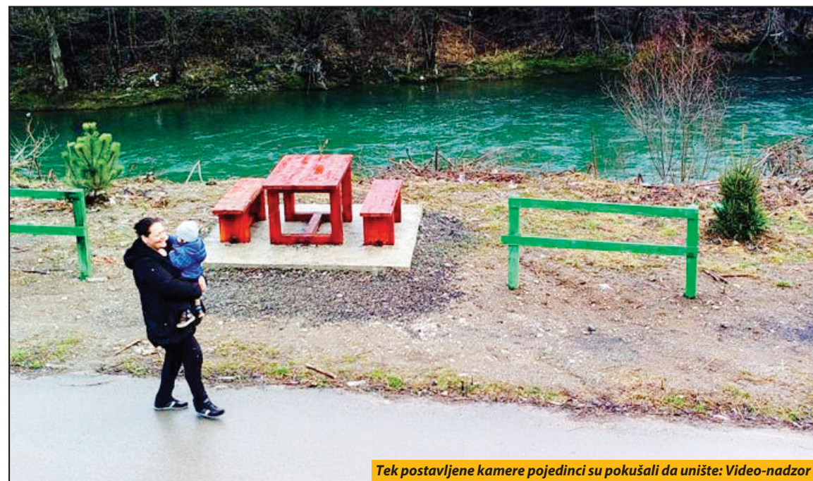
Tek postavljene kamere pojedinci su pokušali da unište: Video-nadzor

Priboj - Povodom okončanja projekta „Rehabilitacija ilegalnih deponija na reki Lim, podizanje svesti o njihovoj štetnosti“, u Priboju je u petak održana završna konferencija.