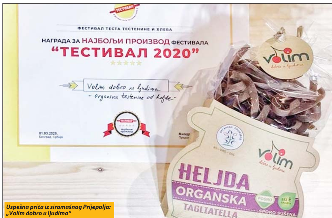
Uspešna priča iz siromašnog Prijepolja: „Volim dobro u ljudima“

Prijepolje - Na upravo završenom Festivalu testa, testenine i hleba pod nazivom „Festival“ održanom u Beogradu, po rečima tima brenda „Volim dobro u ljudima“ stručni je žiri bio oduševljen ukupnim konceptom „Hrana našeg (k)raja“, ukusom testenina i pita, ali i drugih proizvoda. Izbor testenine od heljde za najbolji proizvod festivala je još jedno priznanje za kvalitet organskih testenina i dodatna verifikacija vodeće pozicije ovog brenda kada je u pitanju proizvodnja organskih testenina ne samo u Srbiji, nego i u regionu.