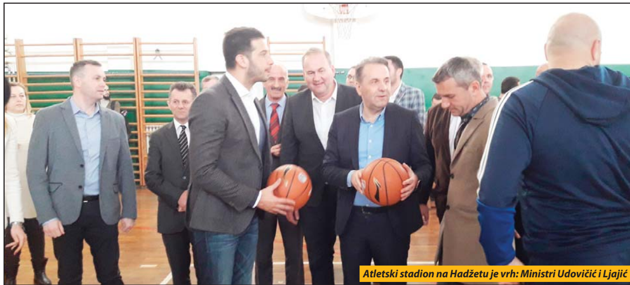
Atletski stadion na Hadžetu je vrh: Ministri Udovičić i Ljajić

Novi Pazar - Potpredsednik Vlade Srbije i ministar trgovine, turizma i telekomunikacija Rasim Ljajić i ministar omladine i sporta Vanja Udovičić posetili su u utorku obrazovne ustanove i sportske objekte u Novom