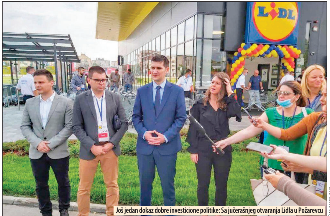
Još jedan dokaz dobre investicione politike: Sa jučerašnjeg otvaranja Lidla u Požarevcu