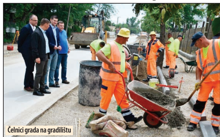
Čelnici grada na gradilištu

Na ovoj lokaciji planirana je kompletna rehabilitacija kolovoza i postojecih trotoara sa izgradnjom trotoara sa desne strane ulice i izgradnjom biciklističkih staza od pruge sa rekonstrukcijom putnog prelaza do ulice Še-