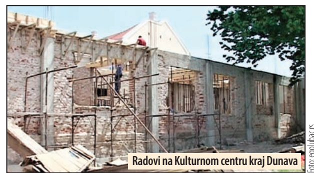
Radovi na Kulturnom centru kraj Dunava

Realizacijom planiranih projekata u gradu Golupcu i u naseljima stvaraju se uslovi za bolji život građana. U protekle četiri godine urađeno je više od trideset velikih projekata. U oblasti kulture, iz opštinske kase u opštini Golubac u ovoj godini popravljeno je nekoliko Domova kulture u naseljima. Poslednji radovi u ovoj godini