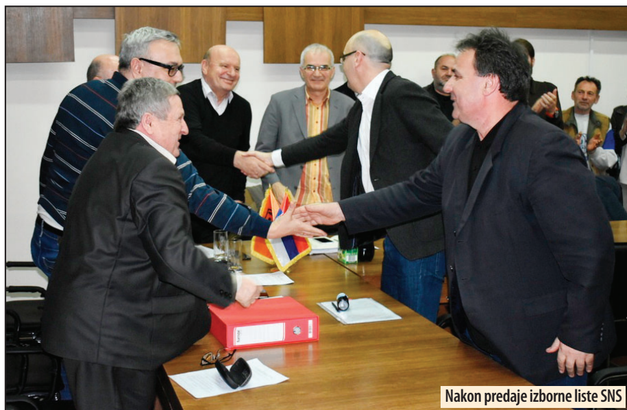
Nakon predaje izborne liste SNS

- Lista Dosta je bilo je oborena. Sa 696 validnih potpisa. Zamerka je vreme u kome smo prikupili dopune. Predali smo izjave koje do 5. juna nismo ubacili u elektronskom obliku