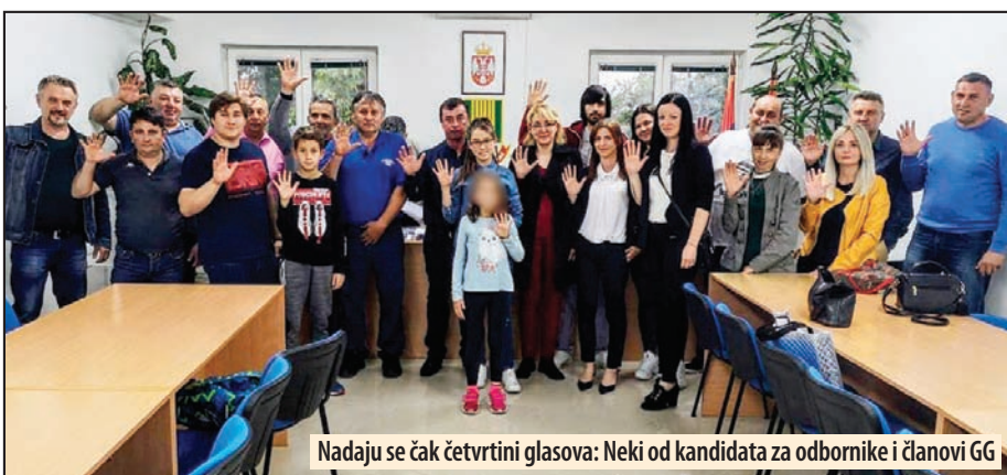
Nadaju se čak četvrtini glasova: Neki od kandidata za odbornike i članovi GG

- Bitno je to što su GG pokazale da su uspešna alternativa, do tada neprikosnovanim strankama i da građani kroz njih mogu da biraju i budu birani, te tako da kroje sudbinu svoje opštine kroz ovakvo poli-