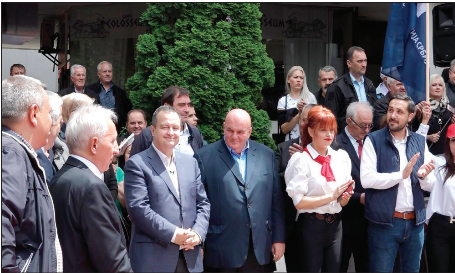
Predizborni miting SPS i JS u Požarevcu