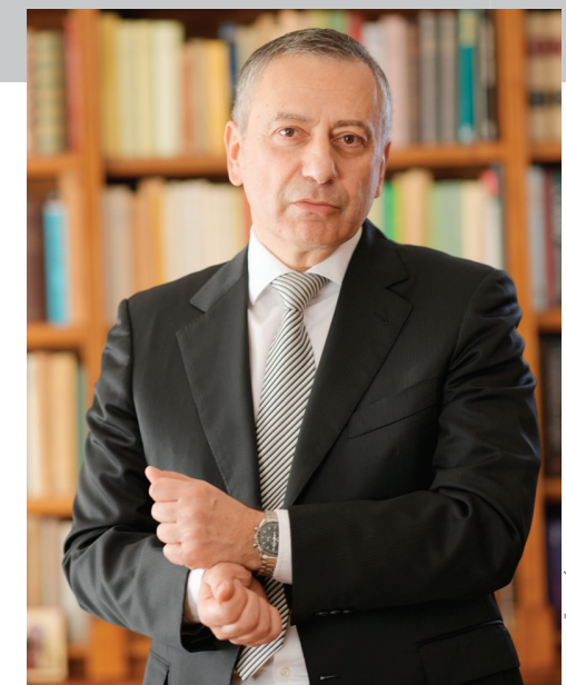
Dr Nikola Samardžić profesor istorije na Filozofskom fakultetu u Beogradu

Poverenje i pouzdanost su reči koje će ubuduće biti od velikog značaja za snagu globalnih integracija, imajući u vidu da je toksični spoj visoke tehnologije i manipulativnih namera pokazao da može imati ozorne efekte po savremene demokratije. Njihov učinak je takav da se na ključnim mestima u važnim nacionalnim i međunarodnim institucijama mogu naći ljudi koji su poverenje stekli na izvrnutim činjenicama i manipulacijom. Promene u tehnološkoj i institucionalnoj sferi već su u toku, kada je reč o regulaciji i suzbijanju prostora za manipulaciju, ali one verovatno neće biti dovoljne. Povratak poverenja i pouzdanosti u javnoj sferi zavisi i od reafirmacije tradicionalnih komunikacionih kanala, najpre masovnih tradicionalnih medija, koji su već dugo u defanzivi, što zbog finansijske krize 2008. godine, što zbog strukturne krize u kojoj su još duže, usled rasta digitalnih tehnologija. Ovi kanali, međutim, imaju nešto što moderne digitalne komunikacione platforme nemaju, a to je etički i regulatorni sistem pravila, koji ih čini pouzdanijim i vrednim poverenja.