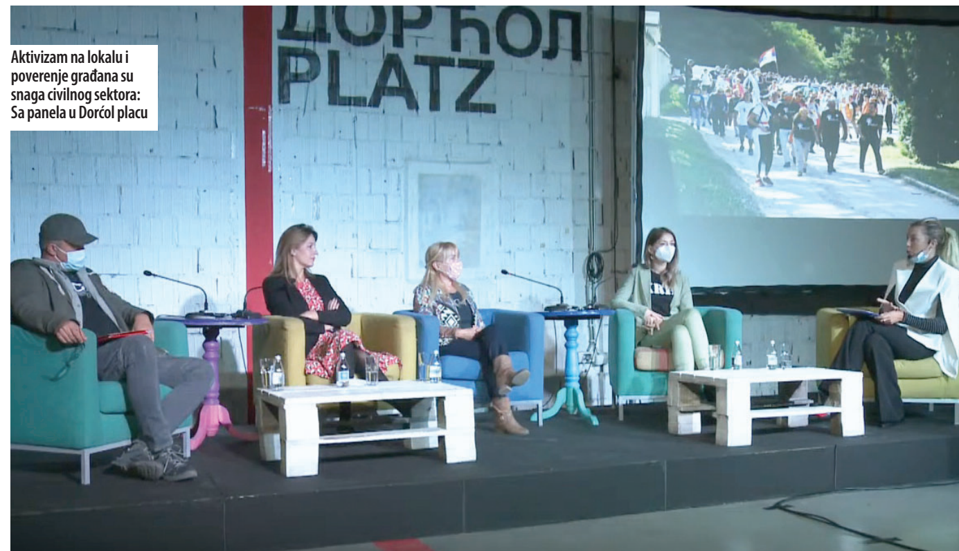
Aktivizam na lokalni i poverenje građana su snaga civilnog sektora: Sa panela u Dorćol placu

– Nama su građani dali takvu snagu, kredibilitet i integritet da država mora za sve da nas konsultuje. NKEU ima poziciju nezaoobilaznog partnera u procesu evrointegracija i država mora da nas pita o svemu. Koliko će nas saslušati i uvažiti naše preporuke zavisi koliko je nešto politički osetljivo pitanje. Postoje situacije gde nam osporavaju i stručnost i kredibilitet a simptomatično je da napadi kreću čim počnemo da kritikujemo neku od važnih tema“, naglasila je Golubović.