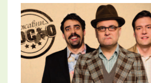
Ekipa Državnog posta