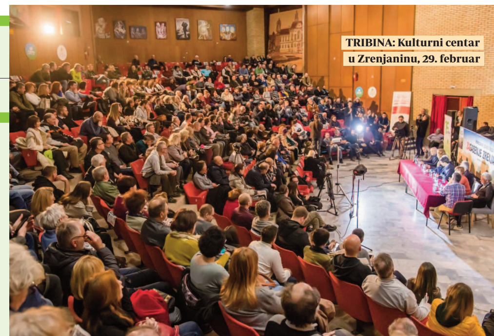
TRIBINA: Kulturni centar u Zrenjaninu, 29. februar