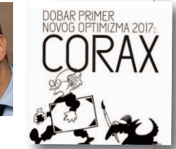
Predrag Koraksić Corax