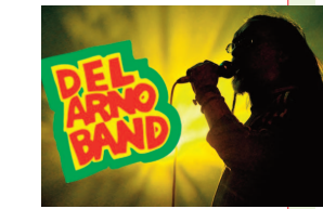
Del Arno Bend