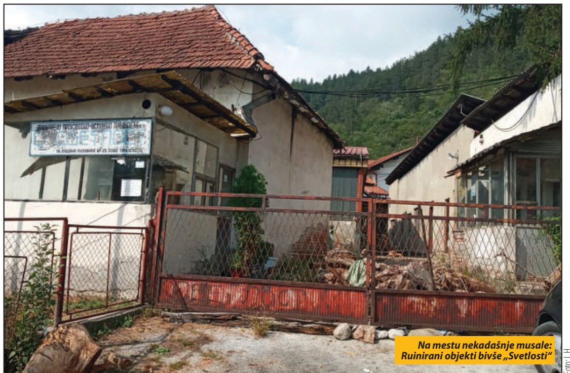
Na mestu nekadašnje musale: Ruinirani objekti bivše „Svetlosti“