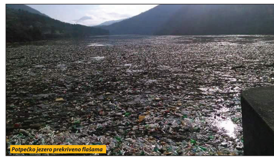
Potpećko jezero prekriveno flašama