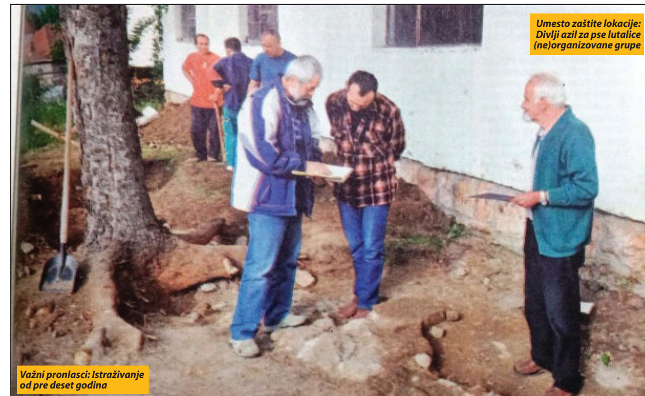
Važni pronalasci: Istraživanje od pre deset godina

Ostali su tek mali koraci do dobijanja građevinske dozvole za izvođenje radova na obnovi musale, a to su: završavanje već pokrenutog imovinsko-pravnog postupka pred nadležnom opštinskom službom za deeksproprijaciju lokaliteta i uklanjanje dotrajalih i devastiranih objekata likvidiranog preduzeća „Svetlost“. Sleđi izrada projekata konzervatorsko-restauratorskih radova re-