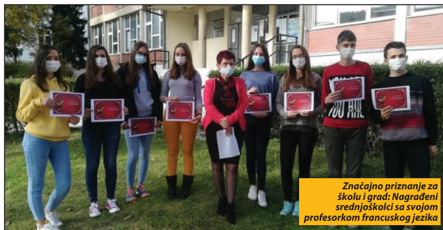
Značajno priznanje za školu i grad: Nagradjeni srednjoškolski sa svojom profesorkom francuskog jezika