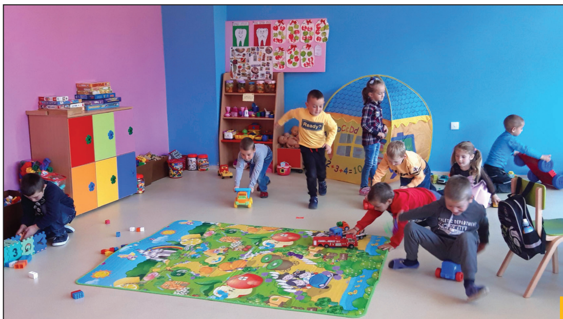
Kutak u božetićkom vrtiću