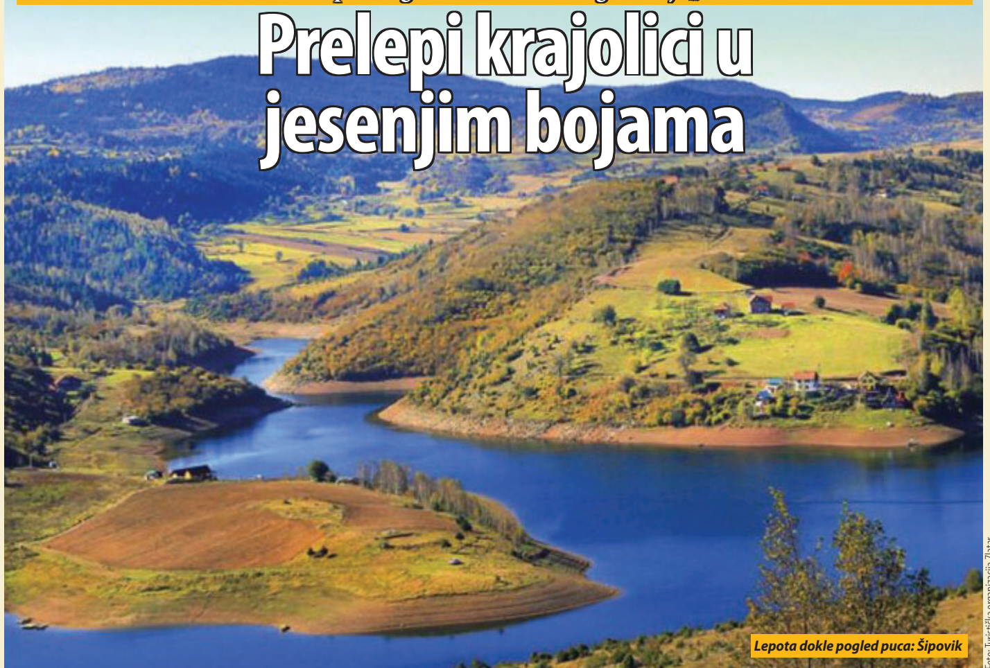
Lepota dokle pogled puca: Šipovik