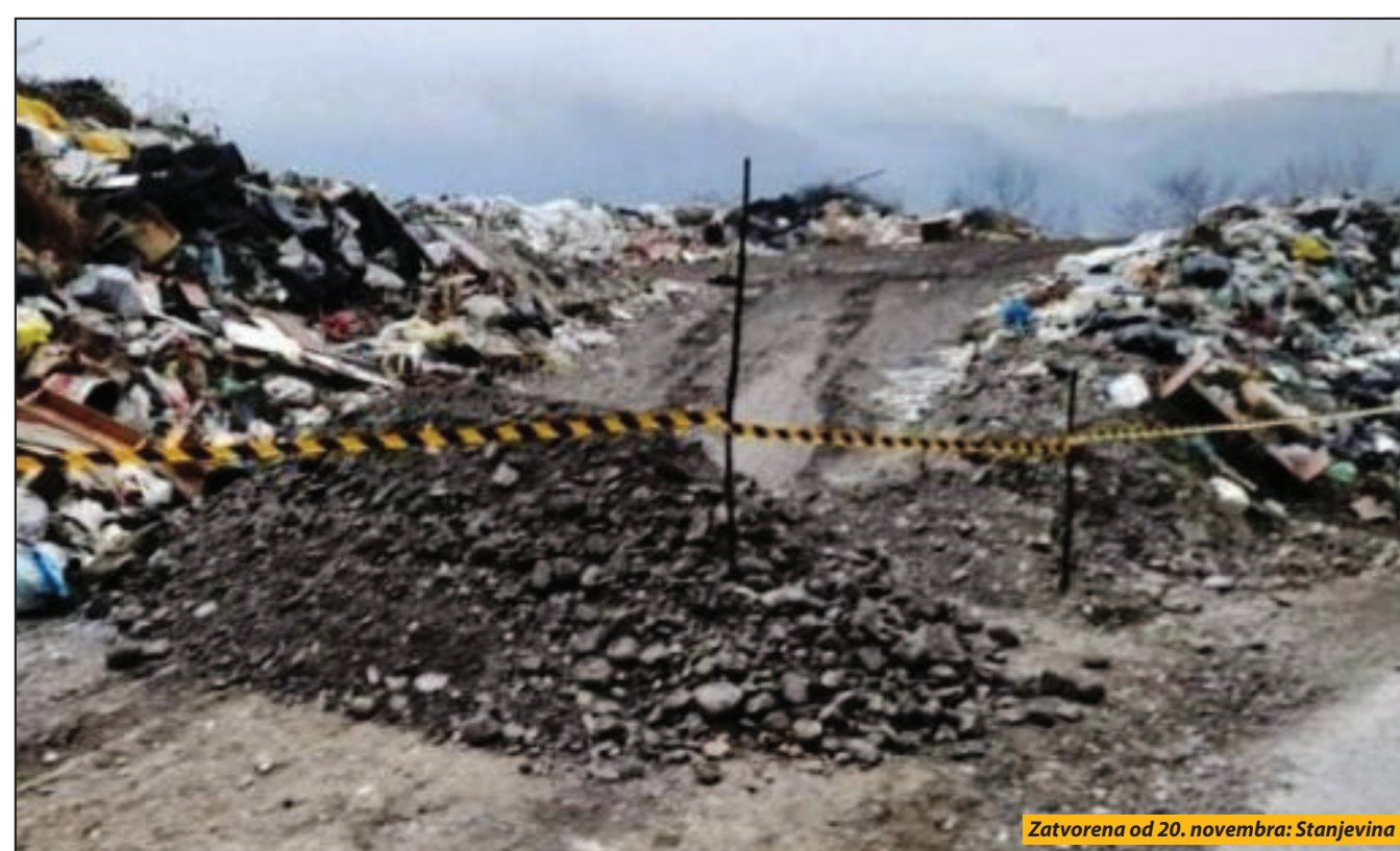
Zatvorena od 20. novembra: Stanjevine

Prijepoljsko smeće će se privremeno, do izgradnje transfer stanice, deponovati na pribojsku deponiju, na