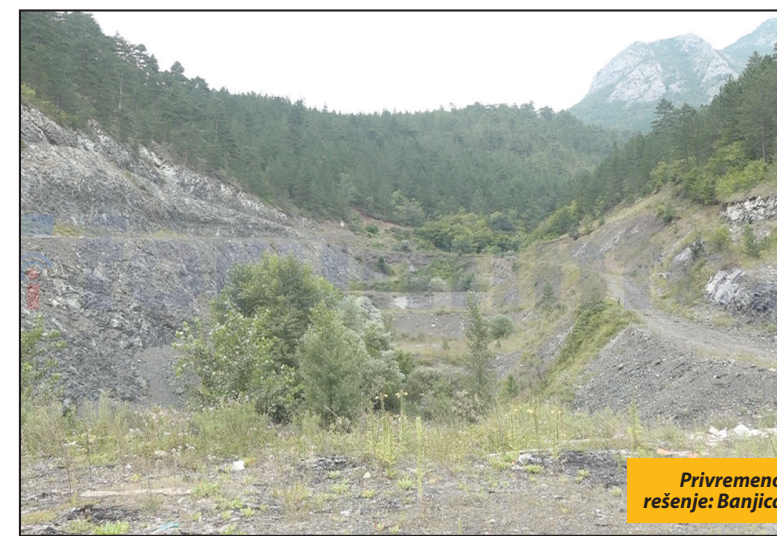
Privremeno rešenje: Banjica