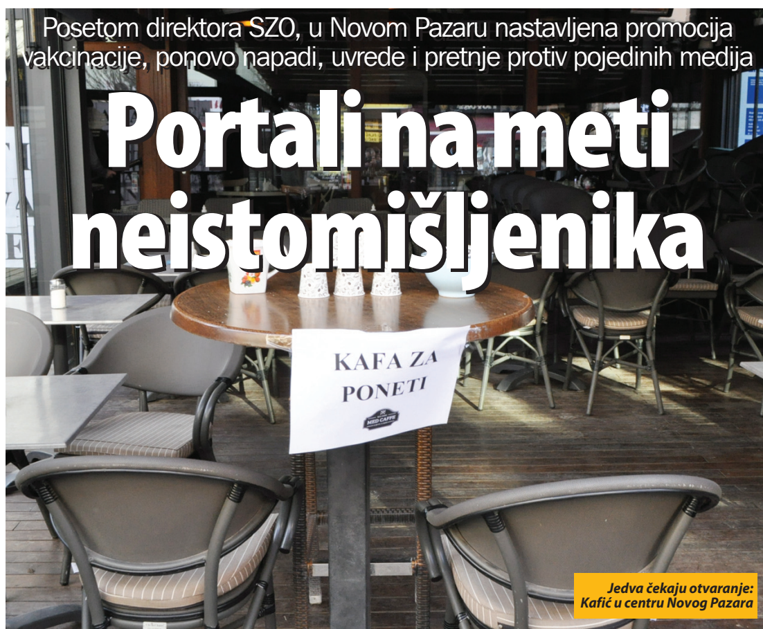
Jedva čekaju otvaranje: Kafić u centru Novog Pazara