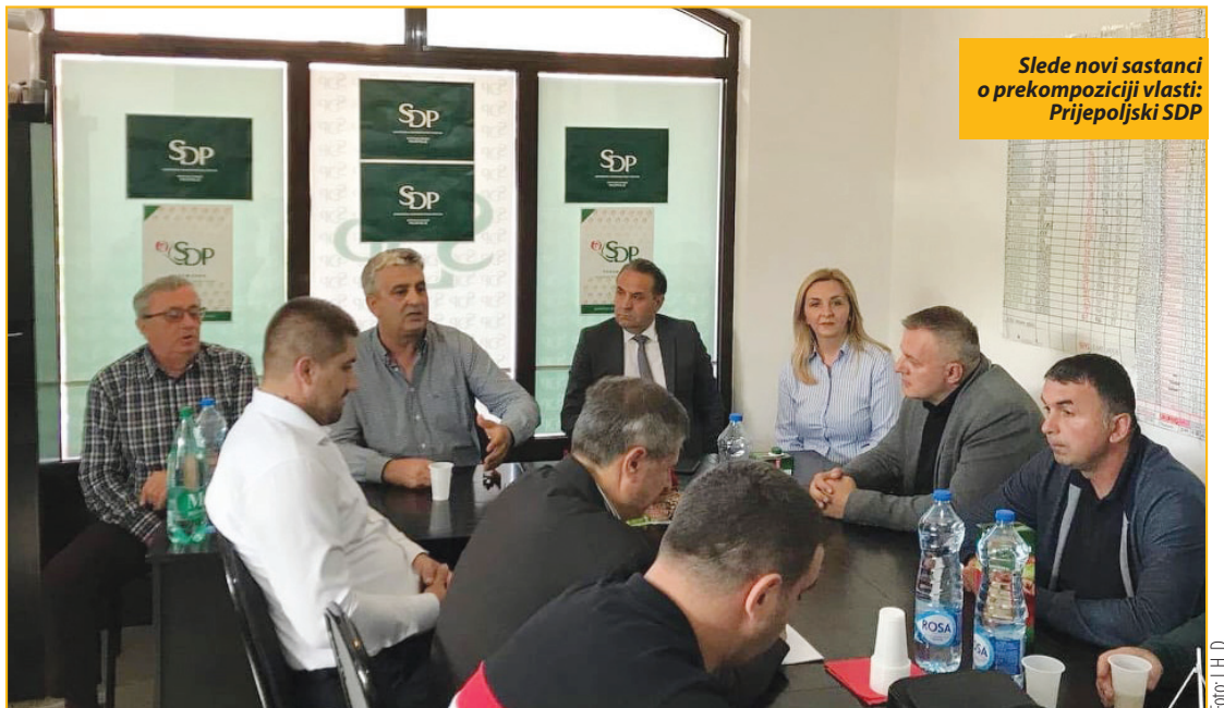
Sljede novi sastanci o prekompoziciji vlasti: Prijepoljski SDP

Prijepolje - Proširenje koalicione vlasti na još dve političke stranke u Prijepolju dovelo je do promene Statuta opštine kao jednog od najvažnijih dokumenata, kako bi Opštinskom veću, mogao da se pridruži još jedan član, odnosno predstavnik Stranke pravde i pomirenja. Ova stranka dobila je i vršioca dužnosti direktora Turističke organizacije i pomoćnika predsednika opštine. Međutim, ono što je uzburkalo na izgled mirno koaliciono partnerstvo jeste predlog osoba koje bi trebalo da nađu svoja mesta u Opštinskom veću, odnosno Opštinskoj upravi.