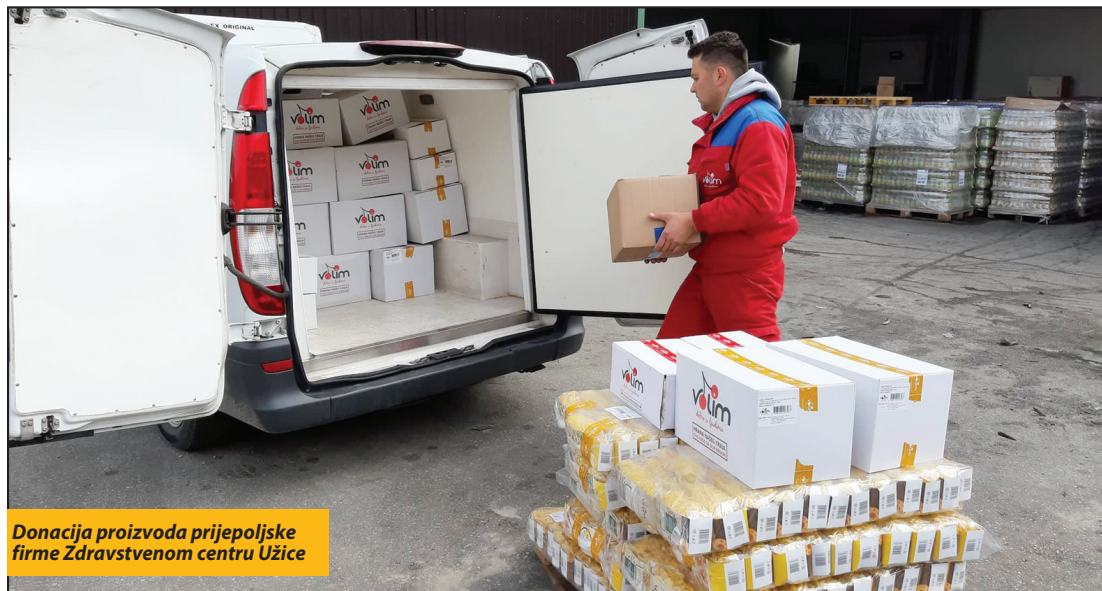
Donacija proizvoda prijepoljske firme Zdravstvenom centru Užice