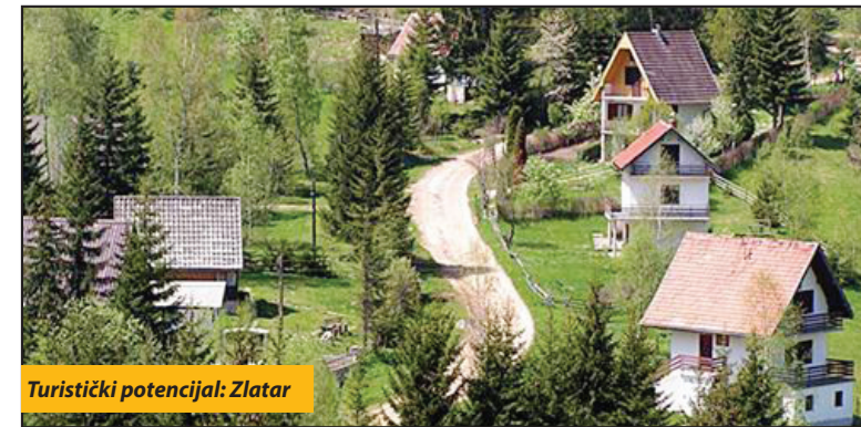
Turistički potencijal: Zlatar

Država izgradnju fekalne kanalizacije u ovašnjoj turističkoj zoni finansira u okviru Programa podrške razvoja poslovne infrastrukture u 2021. godini, a koji se sprovodi pod okriljem resora Ministarstva privrede. Kako ističu u lokalnoj upravi, projekat podrazumeva separatan sistem kanaliziranja otpadnih i atmosferskih voda. - Fekalna kanalizaciona mreža, duga 1.951 metar, gradiće se na potezu Zlatar - Brdo - Crvene vode - Drmanovići.