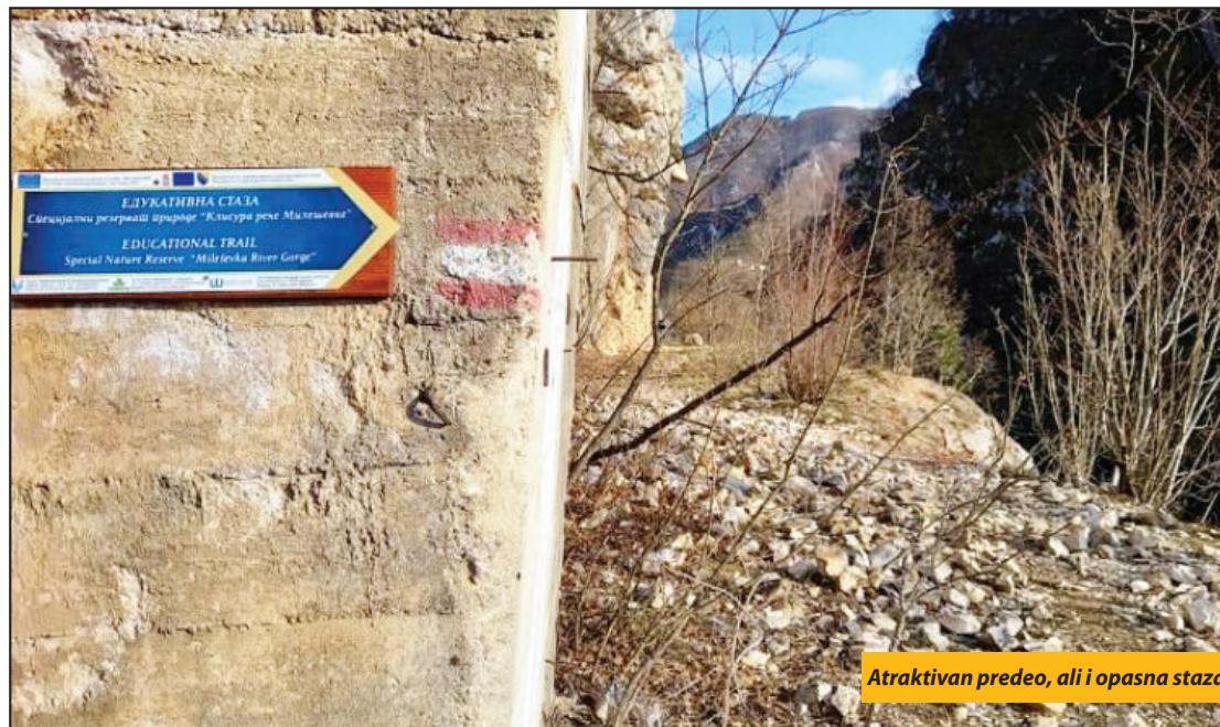
Atraktivan predeo, ali i opasna staza

Prijepolje - Ko je i kada postavio oznake koje upućuju da je reč o „edukativnoj stazi“ iako je reč o neuređenom gradilištu, odnosno nedefinisanom prolazu koji vodi do tunela, a na koji se svakog trena obrušavaju gomile kamenja i gromade stena? To je prvo pitanje koje bi postavio svaki pravi Prijepoljac, odnosno svako ko godinama obilazi ovaj teren i dobro ga poznaje, jer je reč o veoma opasnom mestu, ni malo pogodnom za „edukaciju“, a još manje za „sedenje na klupi“ zarad uživanja u krajolik. No, kako stoji na „putokazu“ reč je o nekakvom projektu prekogranične saradnje Srbije i Bosne i Hercegovine, koji je podržala Evropska unija, a u kome je učestvovalo Javno preduzeće „Srbijašume“.