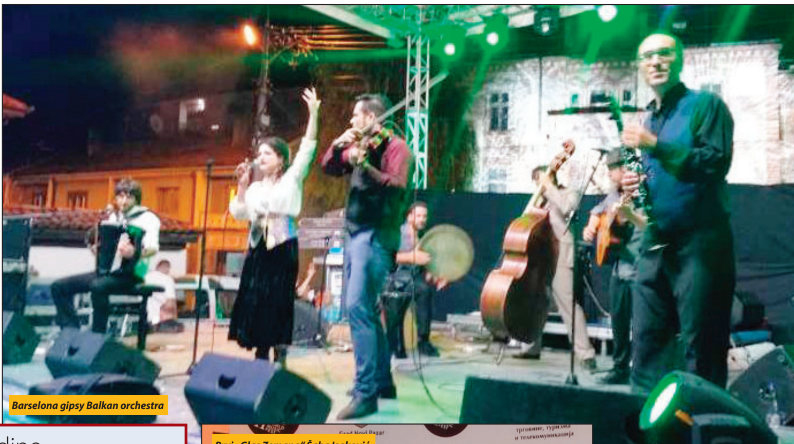
Barcelona gipsy Balkan orchestra