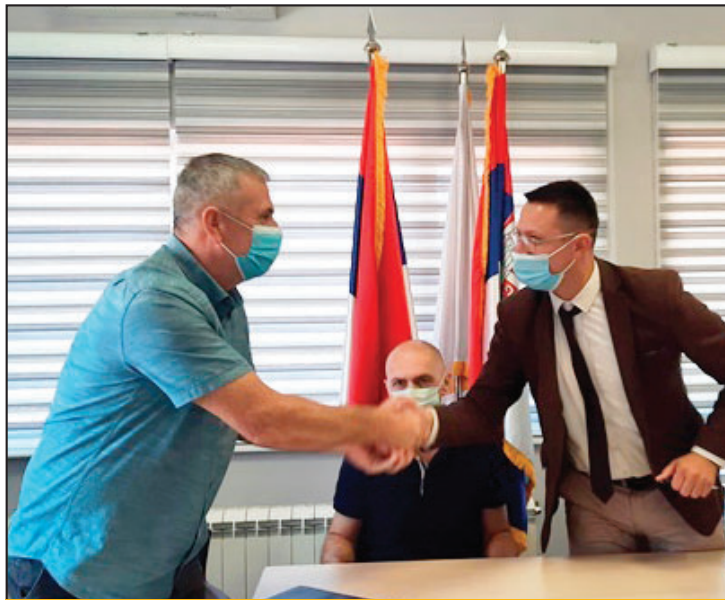
Unapređenje lokalne administracije

„Socijalno ugroženi građani će ostvarivanjem prava u našoj ustanovi istovremeno ostvarivati i neka druga prava koja su se ticala lokalne samou-