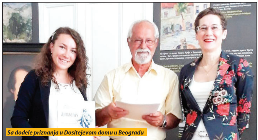
Sa dodele priznanja u Dositiejevom domu u Beogradu

Darovita učenica kaže da joj „vetar u leđa“ u stvaralaštvu nesebično pruža njena mentorka odnosno profesorka srpskog jezika i književno-