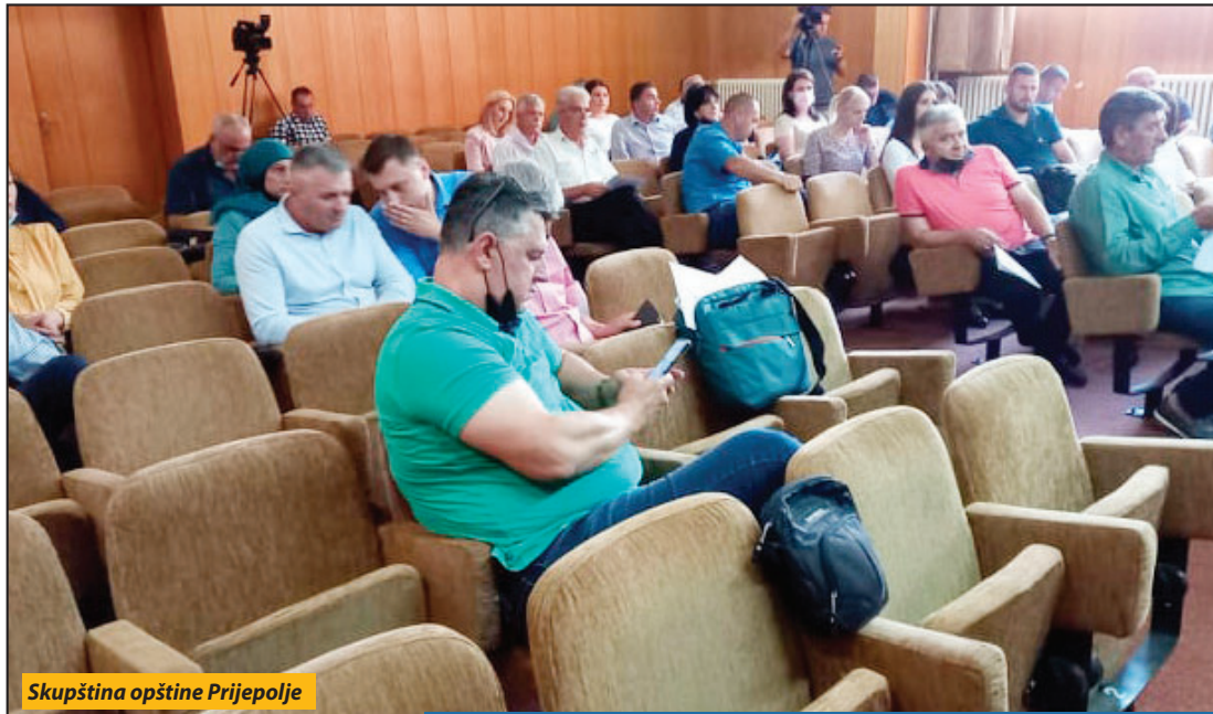
Skupština opštine Prijepolje

Pozivalo se na „pamet, znanje, moral“, na „istoriju“, za mnoge je sve „veličanstveno, velepno, fantastično“ kad je reč ili o njima samima ili članovima njihovih stranaka. Tako neznatno i sitno postaje za govornicom „ogromno“, „značajno“, „bitno“, „najbolje“, „nikad viđeno“. O izveštajima o radu u 2020. godini ustanova koje se finansiraju iz budžeta jedva da je i bilo