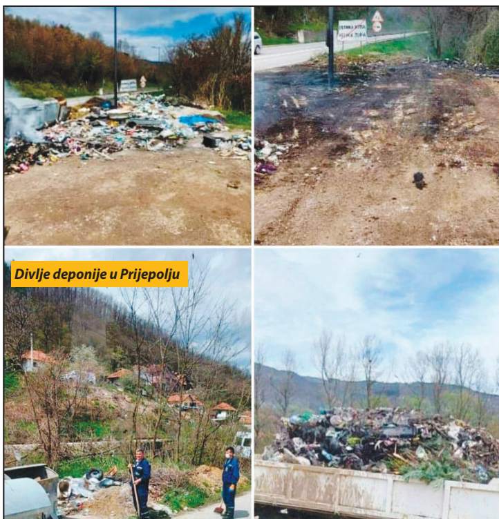
Divlje deponije u Prijepolju

Na sednici Opštinskog veća koja je održana prošle sedmice, pitanju komunalne higijene posvećena je posebna tačka dnevnog reda jer, kako je rečeno, posle zatvaranja nesani tarne deponije Stanjevine, počele su da niču mini Stanjevine, čiji se broj povećava.