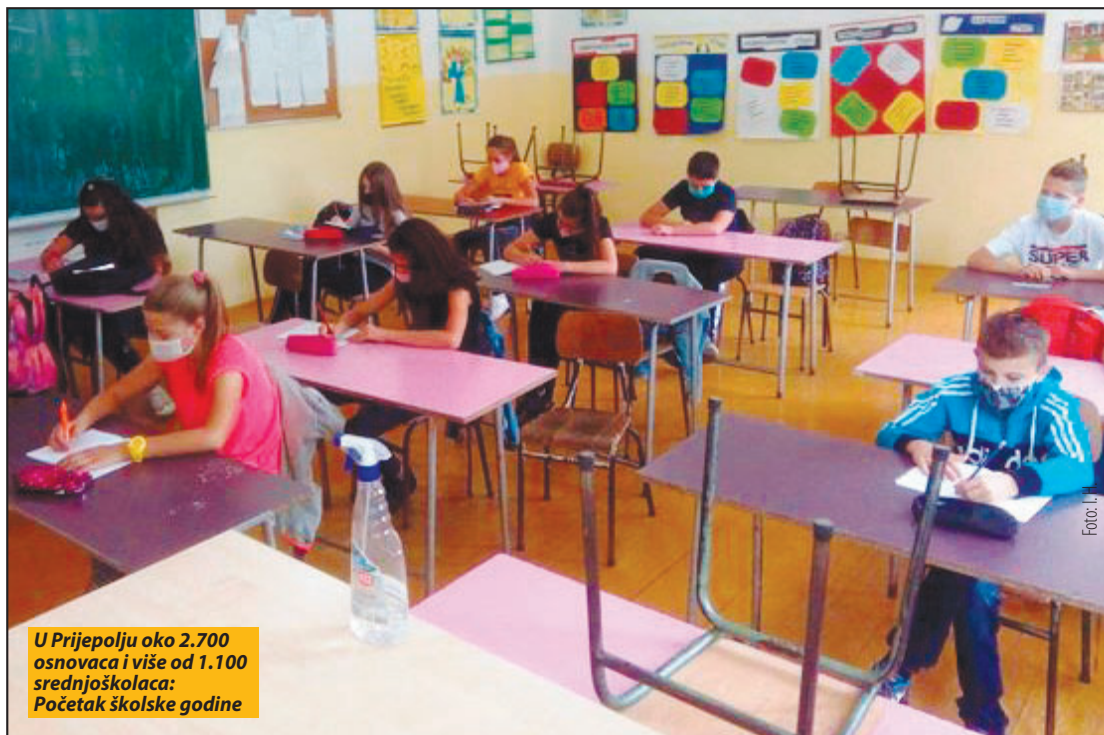
U Prijepolju oko 2.700 osnovaca i više od 1.100 srednjoškolaca: Početak školske godine