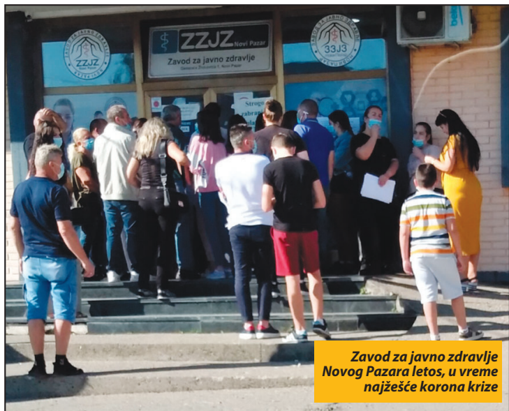
Zavod za javno zdravlje Novog Pazara letos, u vreme najteže korona krize

Na alarmantnu situaciju u ove dve lokalne zajednice, upozorio je i državni sekretar u Ministarstvu zdravlja Mirsad Đerlek, koji je rekao da su tim lokalnim samoupravama upućene preporuke, „kako bi se korona virus obuzdao“. Đerlek veruje da će tutinski štab za vanredne situacije „usvojiti plan po kom treba da se nađe model za povećanje stepena vakcinacije, da se duplira inspekcijski nadzor ugostiteljskih objekata i drugih mesta okupljanja, da se u školama poveća broj dežurstava i uvedu selektivni veliki odmori, kako bi se sprečilo mešanje đaka“.