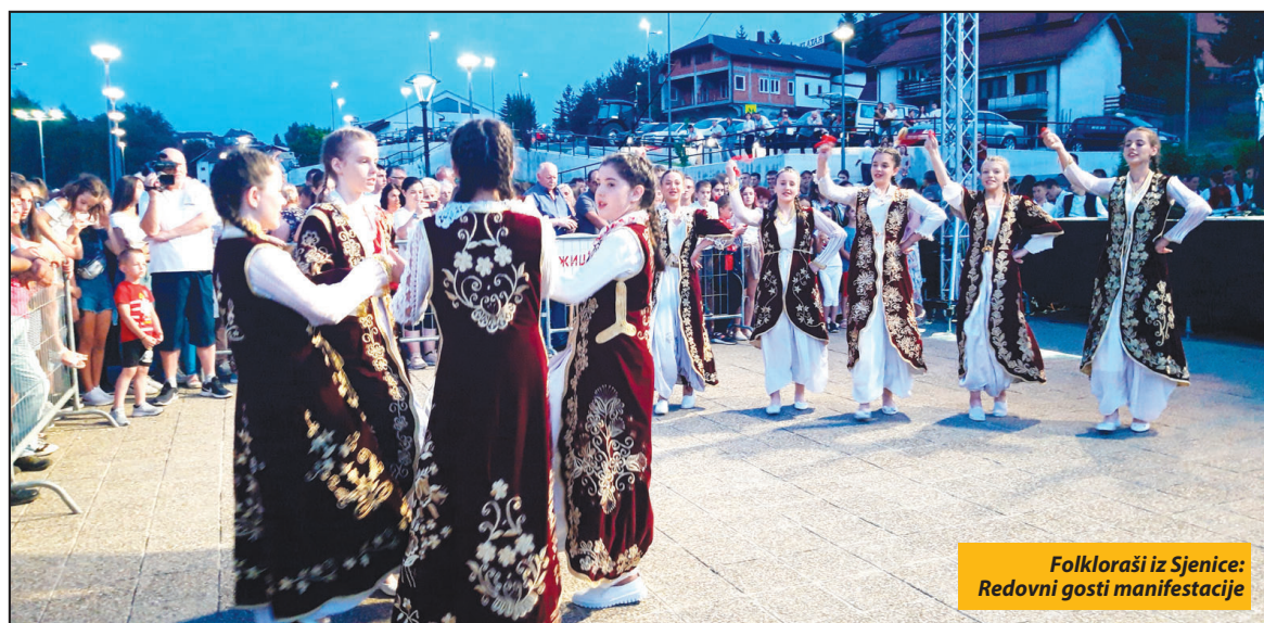
Folkloriši iz Sjenice: Redovni gosti manifestacije

Odlučan utisak na publiku ostavili su gosti iz Prijepolja - članovi KUD-a tamošnjeg Doma kulture. Ansambl je