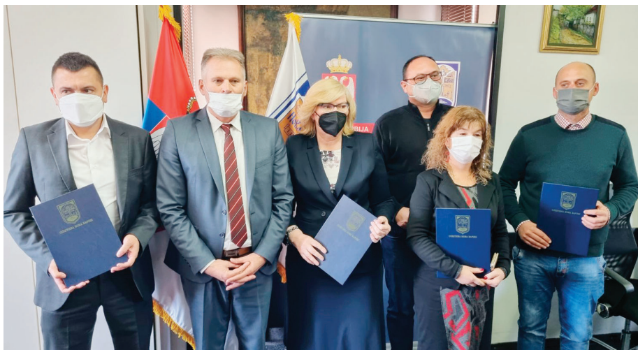
Ovogodišnji dobitnici opštinskih nagrada

Centralni događaj dodela nagrada studentima i đacima i priznanja zaslužnim pojedincima i kolektivima