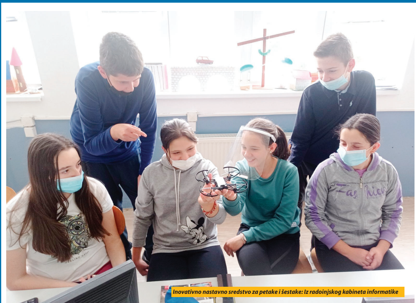
Inovativno nastavno sredstvo za petake i šestake: Iz radoinjskog kabineta informatike

Nova Varoš - Rotari klubovi u Srbiji, u okviru akcije „Za lepšu školu“ koju sprovede uz podršku Ministarstva prosvete, nauke i tehnološkog razvoja, donirali su mini dronove za sedam osnovnih škola na teritoriji opština Nova Varoš, Priboj i Prijepolje. Po jednu bespilotnu letelicu, čija bi primena trebalo da unapredi kvalitet nastave u oblasti informatike, dobili su i OŠ „Živko Ljujić“ i osmoljetka „Gojko Drulović“ u Radoinji. Donacija će da, kako je istaknuto na nedavnoj svečanoj dodeli dronova u Prijepolju za ove tri susedne opštine, utiče na razvoj kompetencija iz oblasti informatike odnosno programiranja. „Ovo inovativno nastavno sredstvo biće od izu-