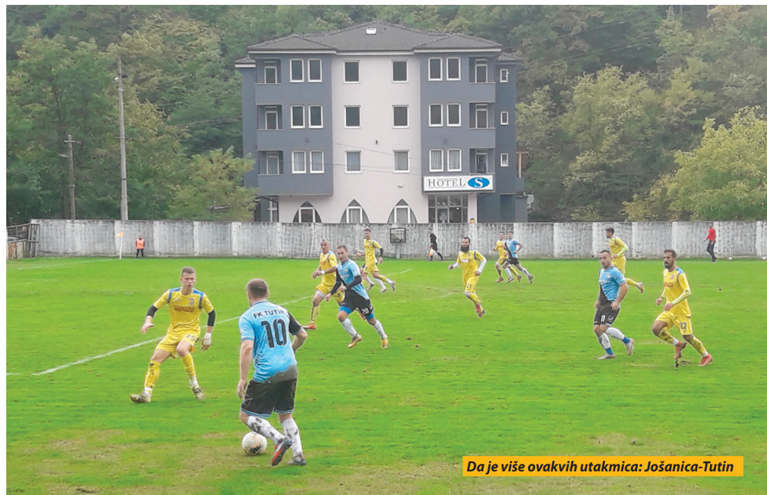
Da je više ovakvih utakmica: Jošanica-Tutin