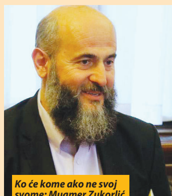
Ko će kome ako ne svoj svome: Muamer Zukorlić