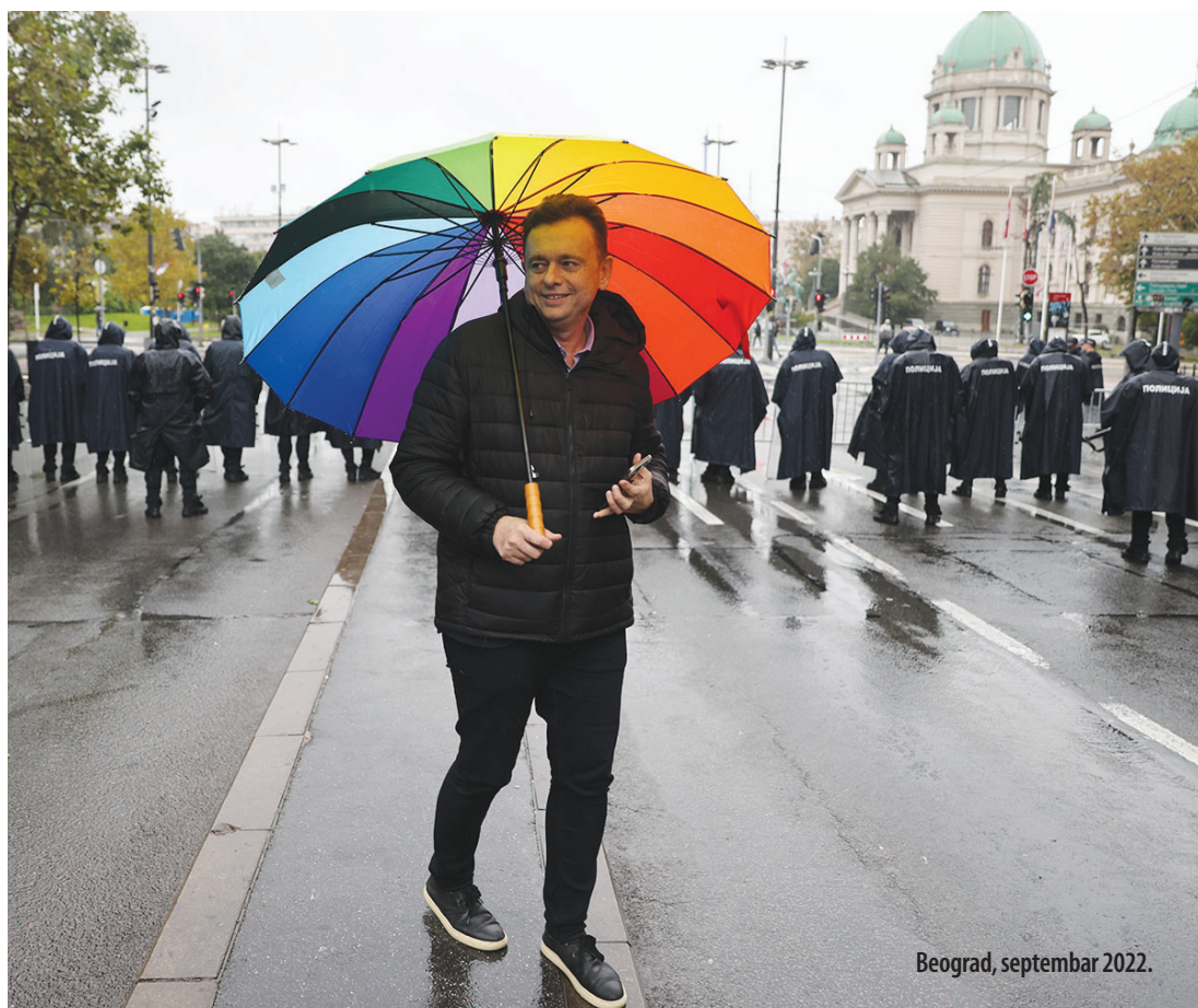
Beograd, septembar 2022.

- Naravno, ako jednoj grupi građana samo zbog njihovog identiteta zabranite slobodu okupljanja uz aktivno tolerisanje govora mržnje koji je trajao nekoliko sedmica jasno je da